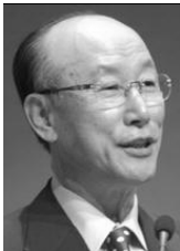
David Yonggi Cho

No existe nada más peligroso que los virus, no solamente aquellos que afectan la salud física del individuo, o el sano funcionamiento de una computadora, sino también aquellos que tienen que ver con la vida religiosa. Desde tiempos antiguos el sectarismo religioso ha sido un mal que el mundo ha sufrido, por lo que millones de personas se perderán en el infierno a causa de ese mal. Sin embargo, en los últimos tiempos la mentira, el engaño del sectarismo ha estado sufriendo mutaciones, cambios que el fenómeno secta religiosa ha ido fraguando a través de los años, en su afán de establecer mega iglesias, evangelismo agresivo, especialmente con un evangelio y organización apartados de la verdad. Y es ahora cuando diversas sectas religiosas se están viendo afectadas por esta nueva corriente de doctrinas sectarias, amenazando con tumbar sus ya arcaicos sistemas sectarios, con el establecimiento de modernas organizaciones y doctrinas falsas.